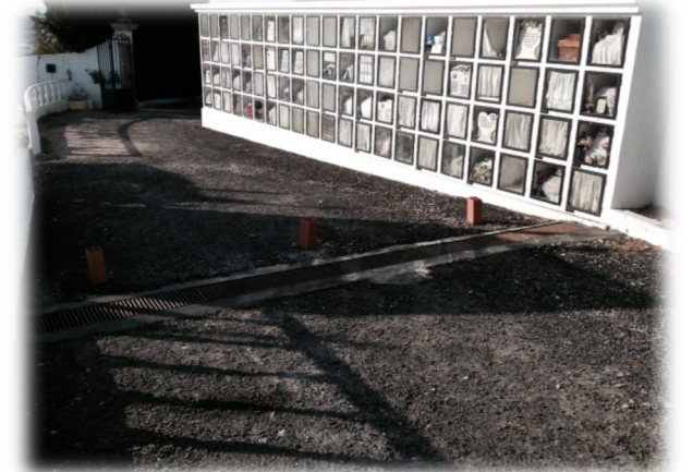
Colocação de nova grelha de recolha de águas