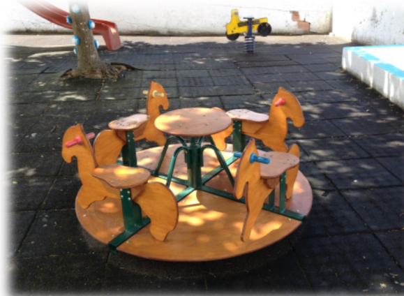
Novo baloiço- carrocel em Fetais