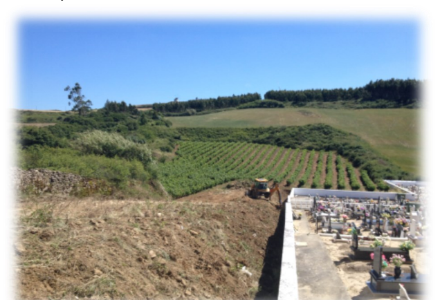
Limpeza e acessibilidades ao novo terreno