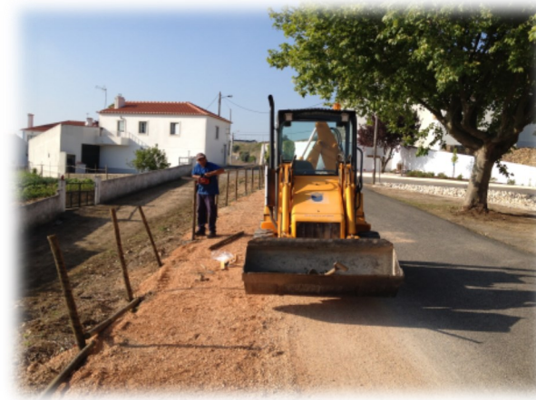
Colocação de corrimão