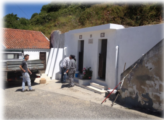
Arranjos e pinturas em W.C. de Pé do Monte