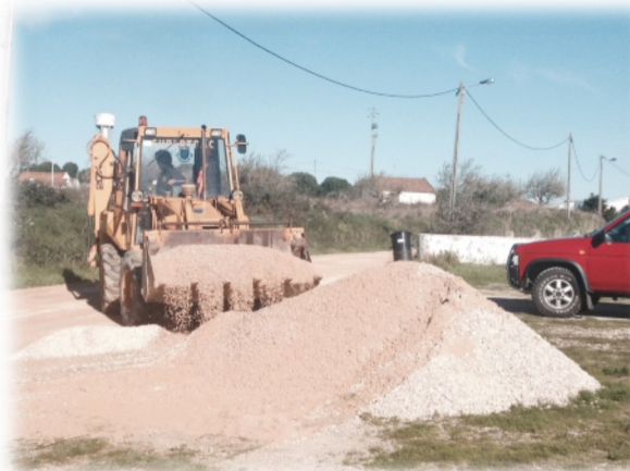
Arranjo de caminho em Zibreira de Fetais