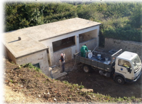
Recuperação de lavadouros de Santo Quintino