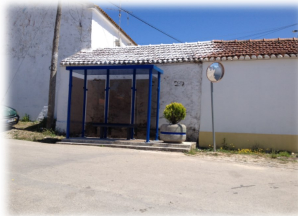
Novo abrigo e arranjos em Chã