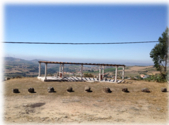
Arranjos no miradouro de Casais Santo Quintino