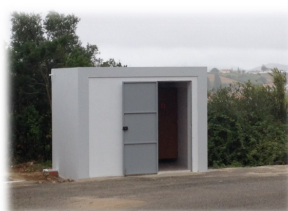
Construção de novo W.C. de apoio