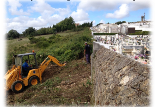
Limpeza de terreno confinante com cemitério