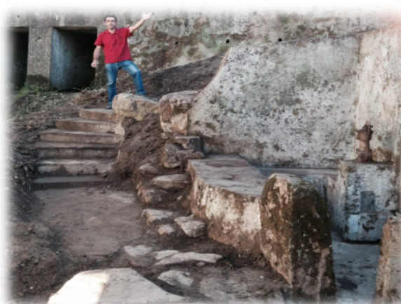
Início de recuperação de mina - A dos Chancos