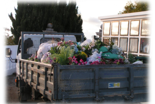
Limpeza e despejo de contentores regularmente