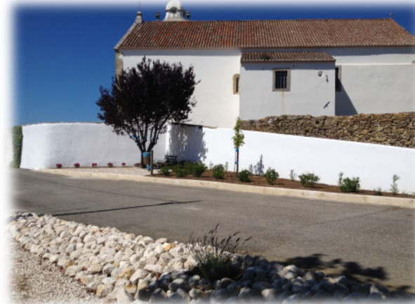
Arranjos com novo espaço ajardinado