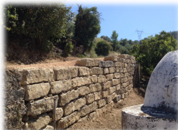
Construção de muro de suporte a caminho -Paço