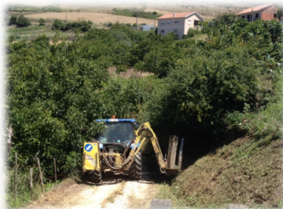
Arranjos em caminho—Casais de Santo Quintino